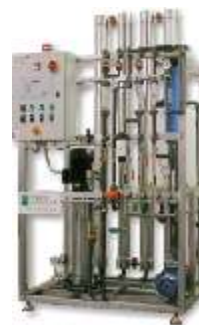
Osmosi inversa 2000 lt/h

La TECN.A. commercializza inoltre prodotti chimici di propria formulazione, quali anti-incrostanti e cleaners per il lavaggio delle membrane.