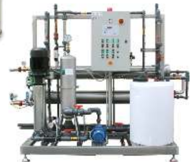
Osmosi inversa 5.000 lt/h