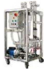
Osmosi inversa 250 lt/h