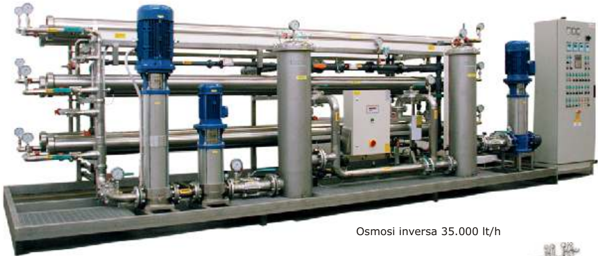
Osmosi inversa 35.000 lt/h

Caratteristiche peculiari degli impianti TECN.A. sono la loro modularità, l'elevata efficienza e l'alto grado di automazione.