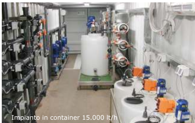
Impianto in container 15.000 lt/h