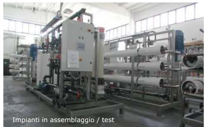
Impianti in assemblaggio / test